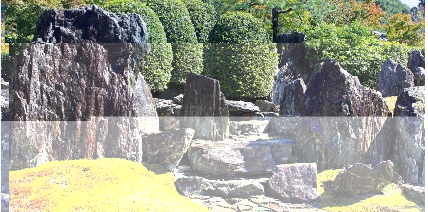
⑥曹源一滴の庭：巨大な鶴島（左）、亀島を豪華極まりない玉潤式の石橋が結ぶ